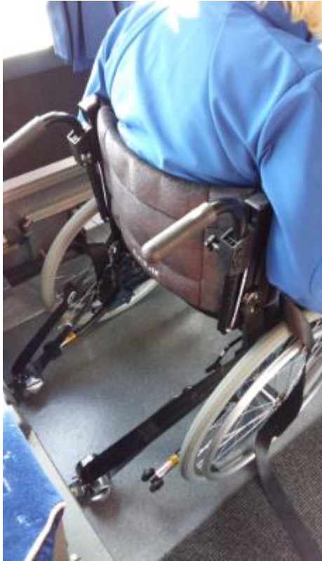
Bild 4: visar fästpunkter i normalgolvsbuss. Bild tagen under testdag av hjälpmedel i buss.

Fästpunkternas placering i bussen är inte tillfredställande för alla rullstolsmodeller, se bild 4. Länstrafiken vet ej om det är enbart den buss som är testad eller om det är alla normalgolvsbussar med rullstolsplats. Fästpunkternas placering krävställa inte vid upphandling utan det är trafikföretagen som välja lämplig buss.