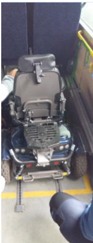
Bild 3: visar skenor i golvet. Bild tagen under testdag av hjälpmedel i buss.